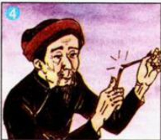
Người cha bèn...