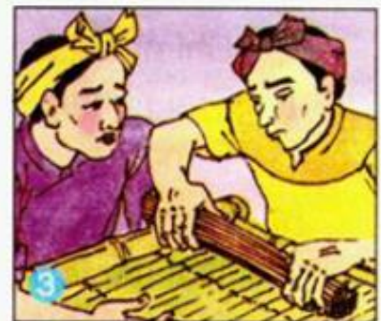
Các người con...