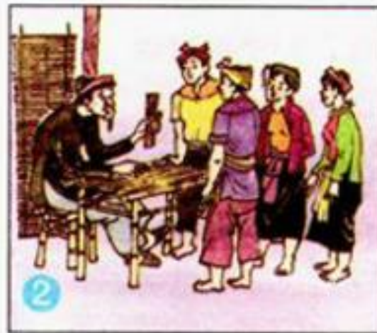
2 Một hôm...