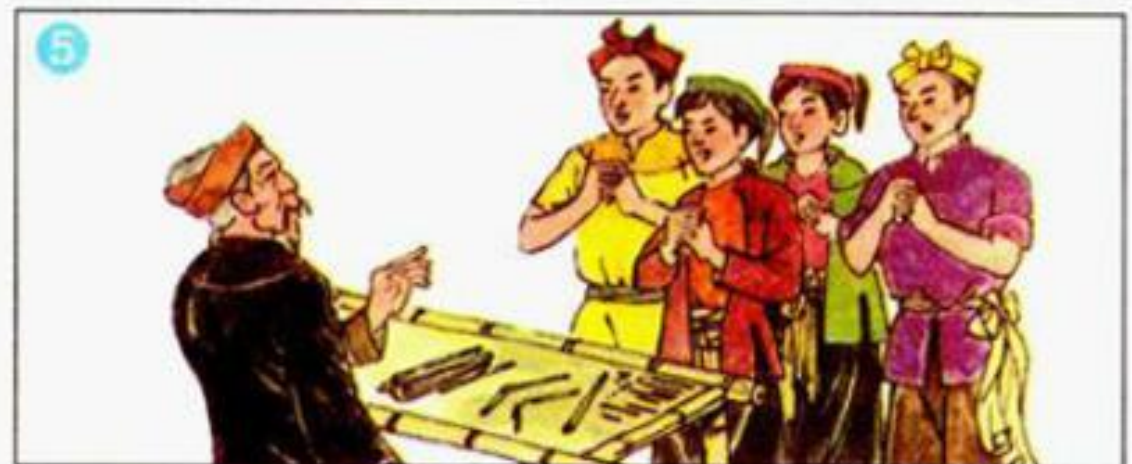
5 Bốn người con cùng nói...