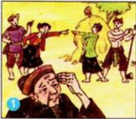
1 Ngày xưa...